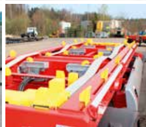
SILO 18 V2 ADONIS