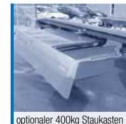
optionaler 400kg Staukasten