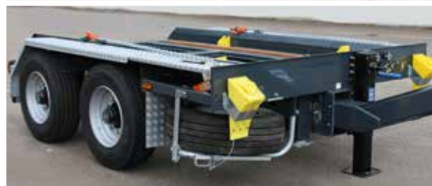
TTA 13 CHRONOS