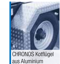
CHRONOS Kotflügel aus Aluminium