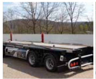
T2M24 HP ADONIS