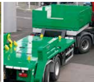
TAK Z4 als Sattelaufleger