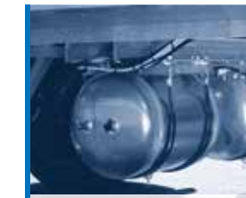
Druckbehälter aus Aluminium