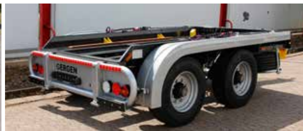
TTA 13 ADONIS